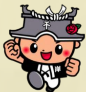
岸和田市CEOちきいくん

クイズに挑戦するとエコバッグがもらえるよ！ エコバッグに好きな絵をかい てオリジナルエコバッグを作ろう！ ※なくなり次第終了とします。