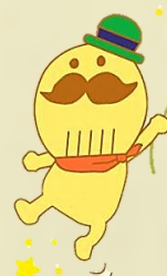
貝塚市イメージキャラクター つけさん