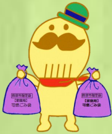
貝塚市イメージキャラクター つげさん

岸和田市、貝塚市、岸和田市貝塚市広域事務組合が連携し、 両市民のごみの 3R(廃棄物の発生抑制・再利用・再資源化) に 関する知識を深め、「 資源循環型社会の形成 」を目的としています。