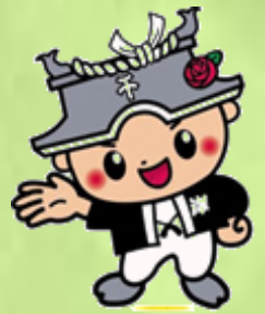
岸和田市CEOちきりくん